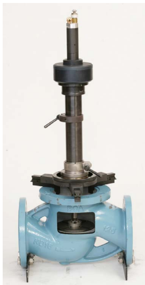
TSV-150 с зажимным патроном (с пневмоприводом)

Благодаря использованию эксцентрика снимается влияние различных окружных скоростей реза. Результат обработки – плоская уплотнительная поверхность.