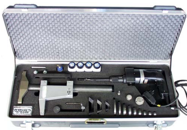
Станок VALVA-1 в чемодане

Станки VALVA образуют - как вся продукция фирмы EFCO - комплектную ремонтную систему.