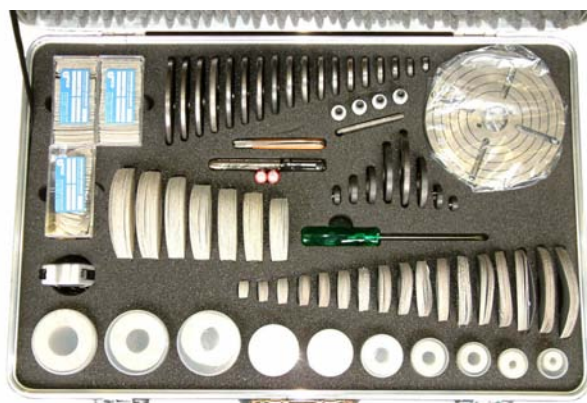
Принадлежности к станку VALVA-1 в чемодане