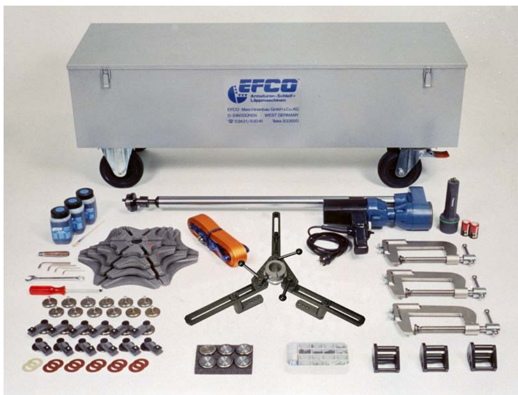
VALVA-2 с тележкой

Оставляем за собой право на технические изменения.