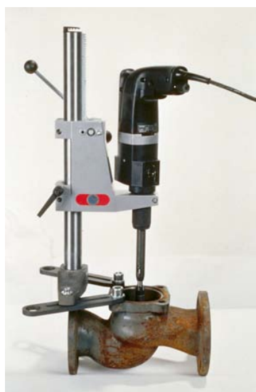
VALVA-1 на стойке