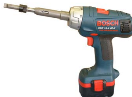
VALVA - с аккумулятором