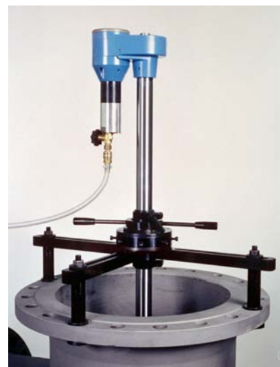
VALVA-2 С закреплением в 3-х точках с дополнительной центровкой