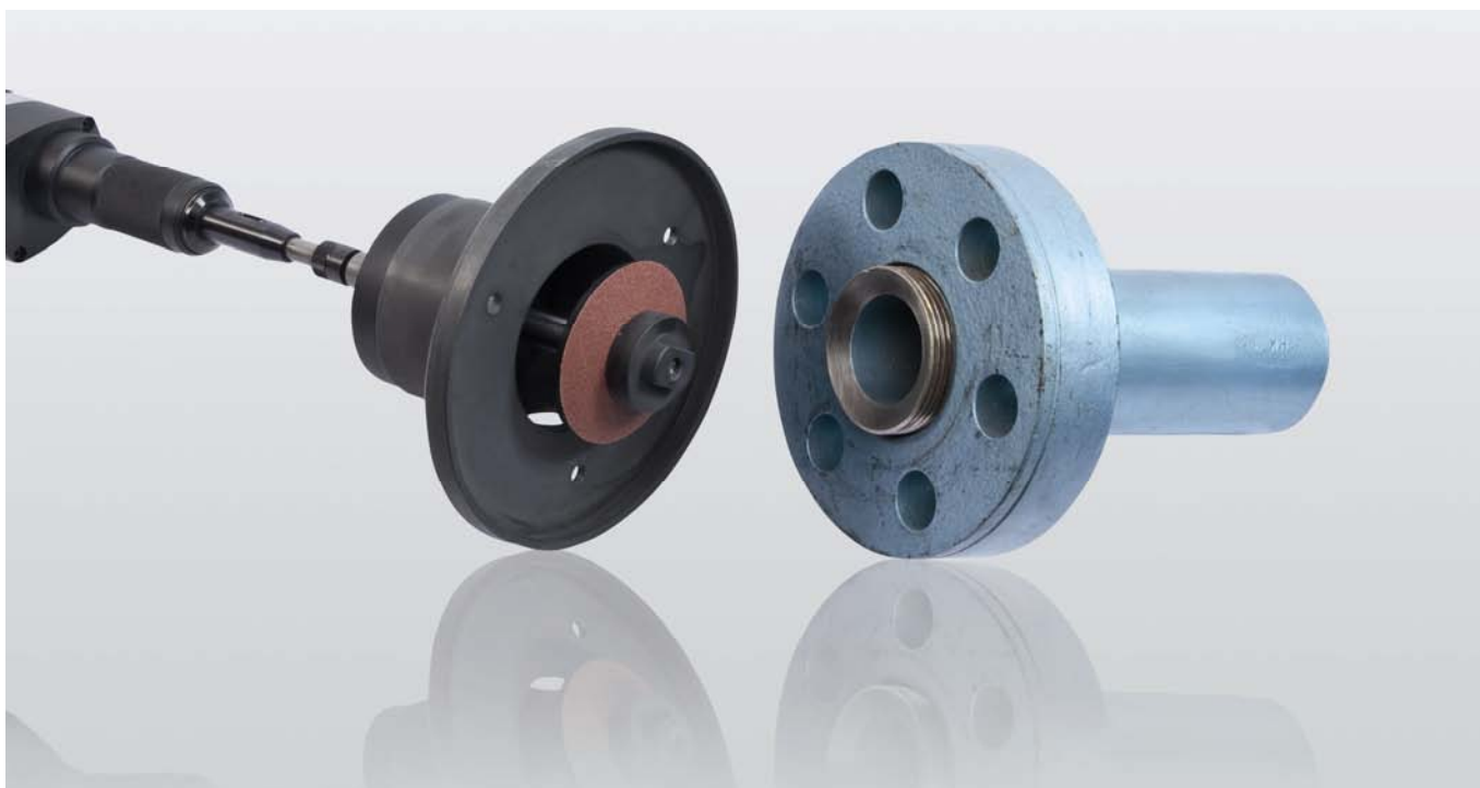
EFCO-LS с направляющей гильзой

Благодаря применению специальных точных направляющих гильз возможна абсолютно центрическая обработка уплотнительной поверхности. Для малых номинальных диаметров используются направляющие гильзы. При обработке труб больших номинальных диаметров применение специального зажимного патрона обеспечивает абсолютно точное ведение шлифовального инструмента.