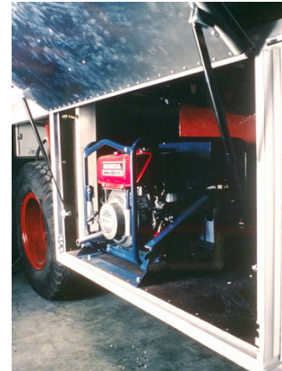
Генератор и компрессор в отапливаемой нижней части кузова

Грузовики и кузова оснащены современной техникой: