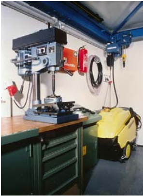
Вертикально-сверлильный станок; очистная установка высокого давления